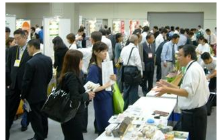
＜過去の交流会の様子＞