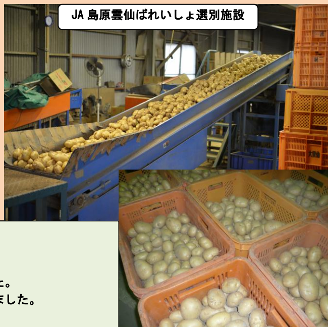
JA 島原雲仙ばれいしょ選別施設

取材当日は、あいにくの大雨。 びしょ濡れになりながらも ばれいしょを掘りいただきました。 寒い中対応していただきありがとうございました。