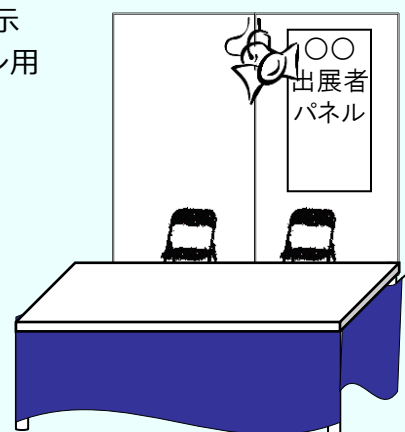
野菜契約取引マッチング・ゲート ～交流会出展者紹介サイト～