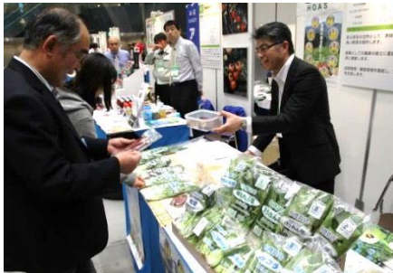
第22回開催(H26.3 東京)会場の様子

※ 登録いただいた方には、機構から受付表をお送りしますので、当日、受付にて受付表をご提示ください。