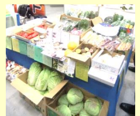
第22回 東京開催の様子 (平成26年3月12日)