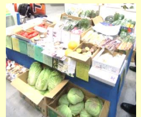
第22回 東京開催の様子（平成26年3月12日）