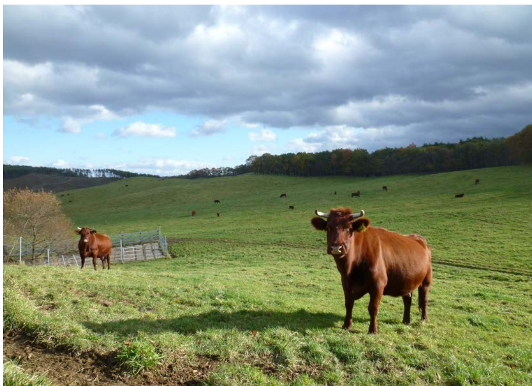
日本短角種の夏山冬里方式による放牧風景