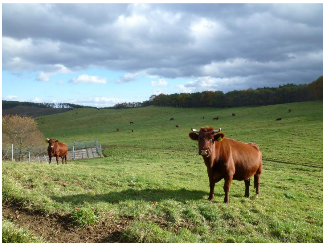
日本短角種の夏山冬里方式による放牧風景

注4：その他は光熱動力費、その他諸材料費、獣医師及び医薬品費、賃借料及び料金、物件税及び公課諸負担、小農機具費、生産管理費、修繕費、支払利子、支払地代。