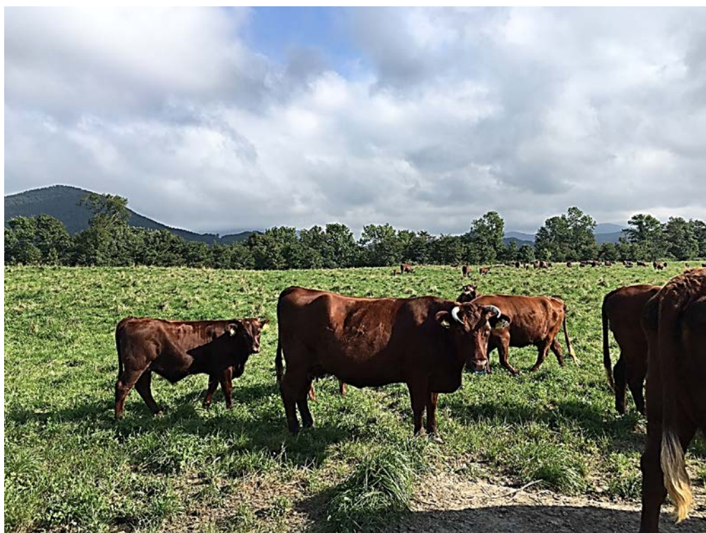
日本短角種の夏山冬里方式による放牧風景

注4：その他は光熱動力費、その他諸材料費、獣医師及び医薬品費、賃借料及び料金、物件税及び公課諸負担、小農機具費、生産管理費、修繕費、支払利子、支払地代。