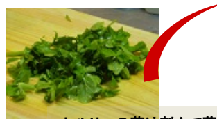
セルリーの葉は刻んで薬