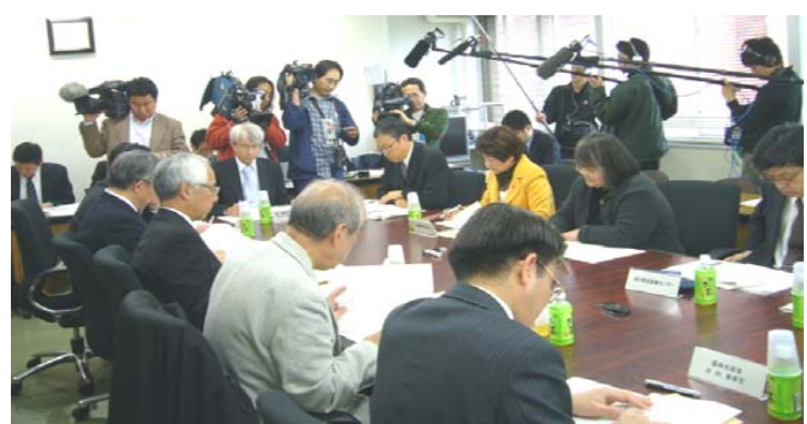
野菜需給協議会幹事会(4/16)