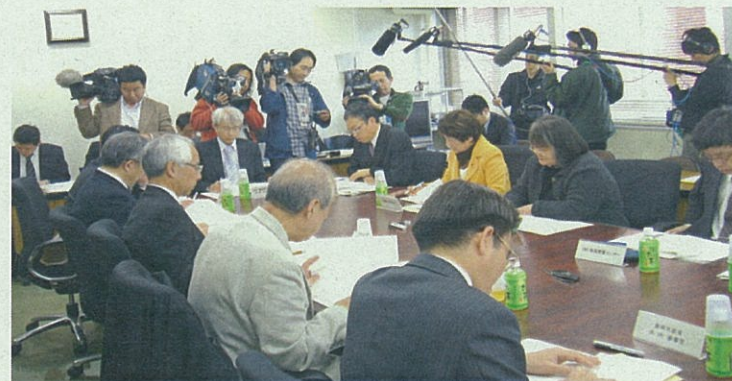
野菜需給協議会幹事会(4/16)