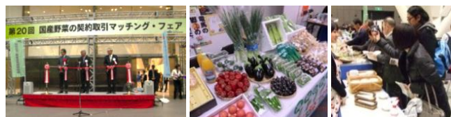
第20回開催の様子(平成25年2月19日)

来場者募集は8月より開始予定。 募集内容はホームページ上で公開します。 ご興味ある方は、ぜひ下記連絡先まで お問い合わせください。