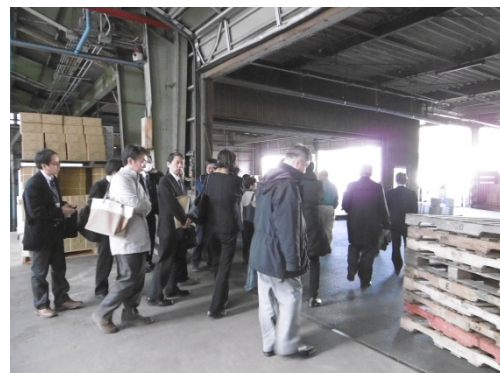
集出荷施設を視察する協議会会員