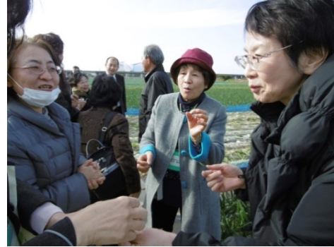
ほ場で意見交換する協議会会員