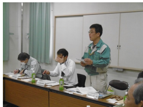
産地概況を説明するJ A担当者