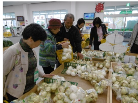
新たまねぎを手にする会員