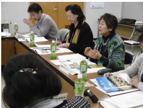
質問する協議会会員