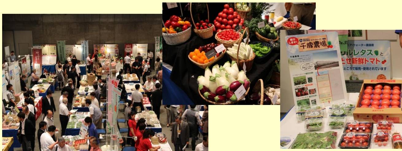
(写真) H26.8.26 札幌開催の様子

加工・業務用をはじめとする国産野菜の契約取引を推進するため、生産者と実需者との交流会を、下記のとおり開催する予定です。関係者の皆様は、奮ってご参加ください。