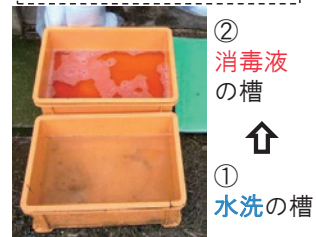
推奨される踏込消毒槽の設置方法