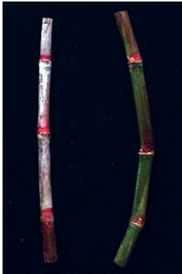
左:剥葉前の茎 右:剥葉し、日光にさらされた茎

農林23号(Ni23)は、2006年(平成18年)に鹿児島県の奨励品種に採用されました。発芽・萌芽、茎伸長にすぐれ、春植え、夏植え、株出しのいずれの作型でも多収の品種です。