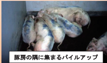
豚房の隅に集まるパイルアップ