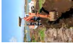
天地返し (土層改良)