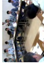
協議会による検討