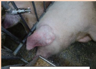
耳翼の紫斑（チアノーゼ）

発熱、食欲不振、元気消失、うずくまり、便秘に続く下痢、呼吸障害等 異状を発見したら直ちに通報しましょう！