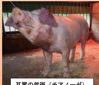
耳翼の紫斑（チアノーゼ）