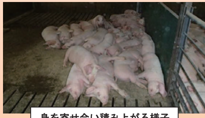
身を寄せ合い積み上がる様子 （パイルアップ）