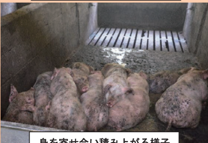
身を寄せ合い積み上がる様子 （パイルアップ）