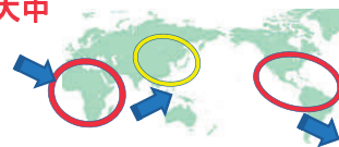
南北アメリカ→アフリカ→アジアへと拡大