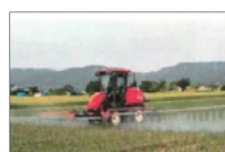
農薬散布による防除