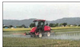
農薬散布による防除