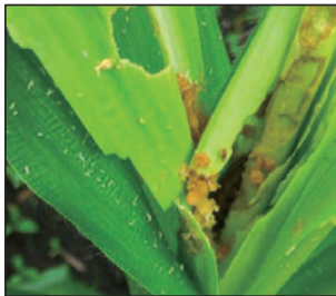
飼料用とうもろこしが食害を受けたところ

ツマジロクサヨトウの防除に使用できる農薬のリストが更新されました。疑わしい害虫を発見した場合は、病害虫防除所までご連絡ください。