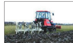
収穫後は速やかにすき込み

( http://www.maff.go.jp/j/syouan/syokubo/keneki/k_kokunai/tumajiro.html )