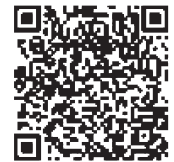
4次計画リーフレット

欠です。新たな計画の下、より一層食育が推進されるよう、皆さまの御協力をお願いします。4次計画のリーフレットは以下のサイトに掲載しておりますので、ご参照ください。(https://www.maff.go.jp/j/syokuiku/plan/4_plan/index.html)