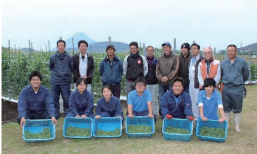
写真1 試験栽培に参加した地元の山川高校の生徒と生産者