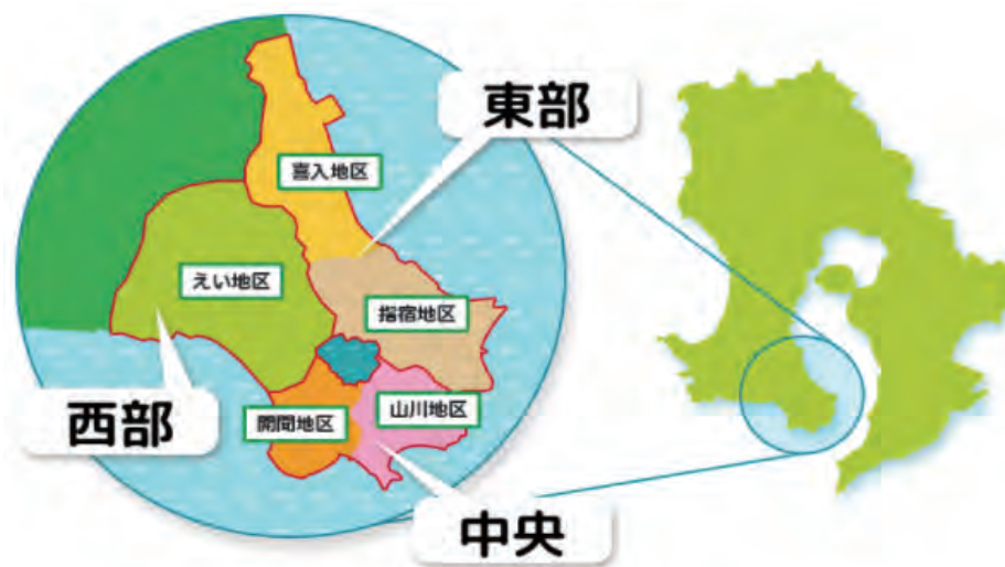
図1 JAいぶすきの位置図

指宿市では、そらまめ、スナップえんどう、オクラの栽培が盛んで、日本一の生産量を誇る産地である。夏場はオクラ、さつまいも、すいか、スイートコーンなどを栽培し、冬場はそらまめ、グリーンピース（実えんどう）、スナップえんどう、キャベツなどを栽培している。山川地区・開聞地区においては、開聞岳の噴火の影響で土壌が