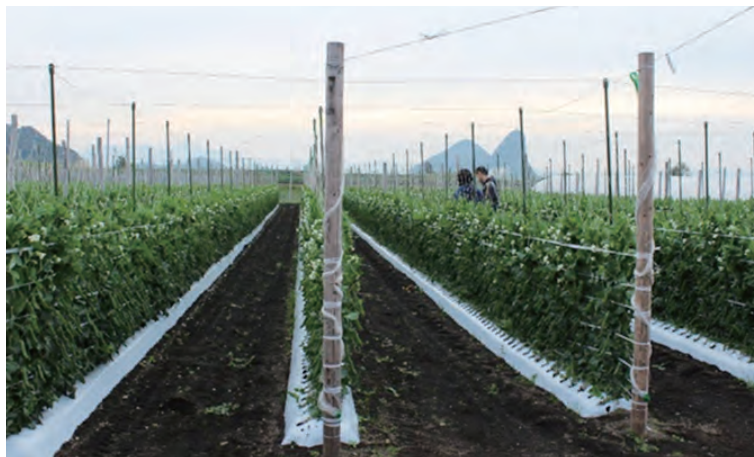
写真3 「まめこぞう」の圃場