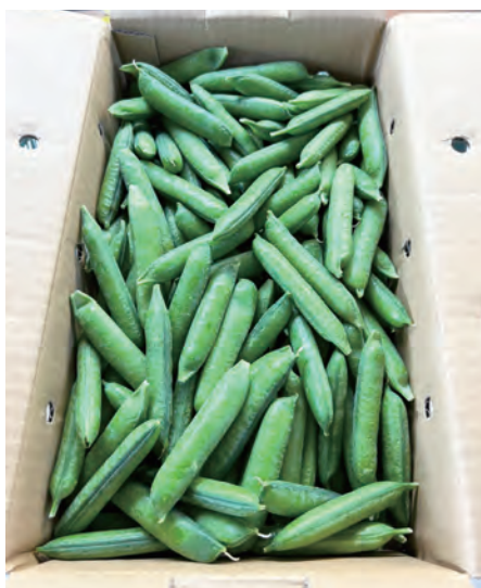
写真4 選果場で箱詰めされたグリーンピース