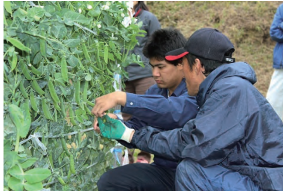
写真2 生産者から収穫の指導を受ける山川高校の生徒