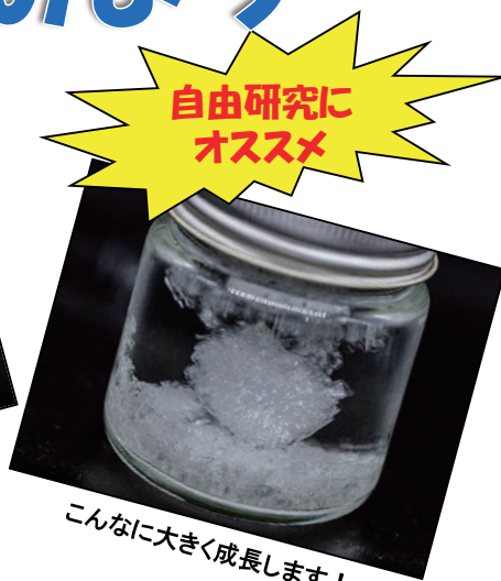
こんなに大きく成長します！