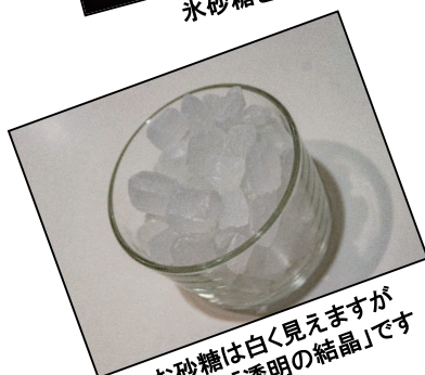
お砂糖は白く見えますが 実際は「透明の結晶」です