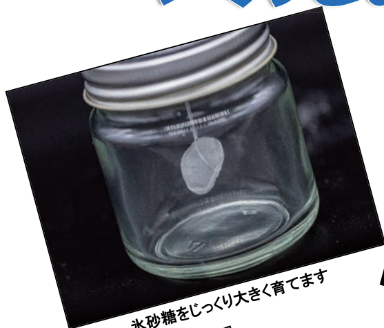
氷砂糖をじっくり大きく育てます