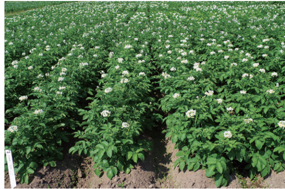
写真1 「コナヒメ」の塊茎（左）と茎葉（右）

「コナヒメ」開発の経緯の一つに、土壌害虫である「ジャガイモシストセンチュウ」の発生地域拡大が挙げられます。ジャガイモシストセンチュウは土壌に生息する線虫で、ばれいしょに寄生し大きな生育阻害を引き起こします。発生地域拡大を防ぐべく、北海道ではばれいしょを含めた輪作体系を組み、感染防止・線虫の密度低減を進めてきましたが、ジャガイモシストセンチュウはシストという硬い殻で卵を包み込み、長期間にわたり（数年～10年以上）土壌中に潜むことができるため、間隔を空けてばれいしょを作付けしたとしても、土壌に潜伏したシストから幼虫がふ化し、ばれいしょに寄生してしまいます。このため密度低減に向けては、シストを形成させないことが最も有効な対策であり、その一つとして抵抗性品種の開発が各育成機関で進められてきました。ジャガイモシストセンチュウ抵抗性を持つ品種は、線虫が根に寄生しても、そこで線虫をとどめてしまうため、シストの形成を防ぐことができます。このため、翌作以降のジャガイモシストセンチュウの発生拡大を防ぐだけでなく、未発生圃場 ほしゅう で使用することで、ジャガイモシストセンチュウのまん延を抑止することができます。