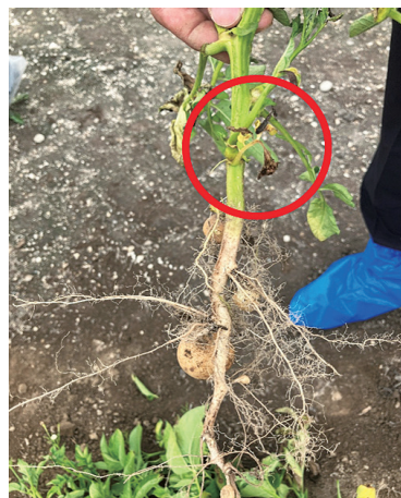
写真2 黒あざ病に罹患し黄化した茎葉の様子（左）、気中塊茎の様子（右）