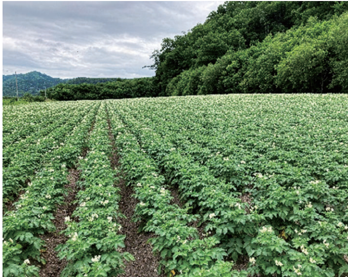
写真3 茎葉が弱勢となった「コナヒメ」の圃場